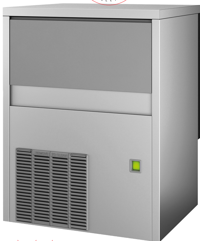
MODÈLE PRÉSENTÉ : SLF190